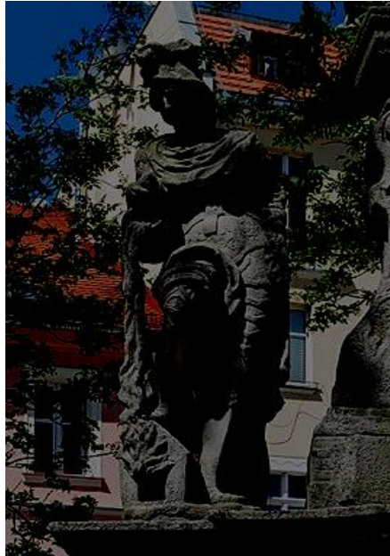
Figura świętego Floriana w Dusznikach Zdroju

Święto Strażaka to również okazja do zabawy. Specjalnie na ten dzień przygotowaliśmy dla Was krzyżówkę.